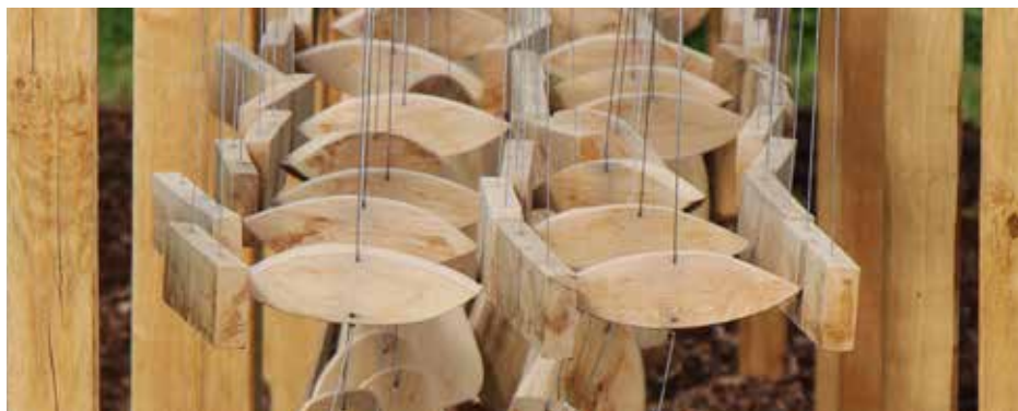
Chant sonore © Will Menter