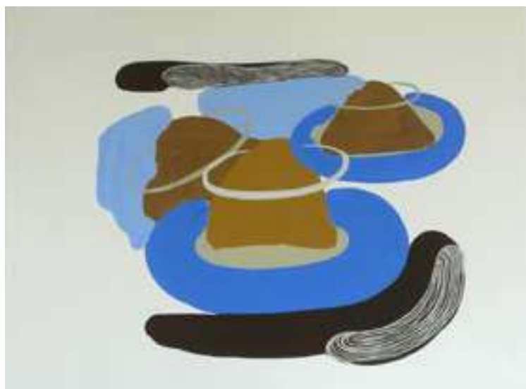
Paysage brésilien