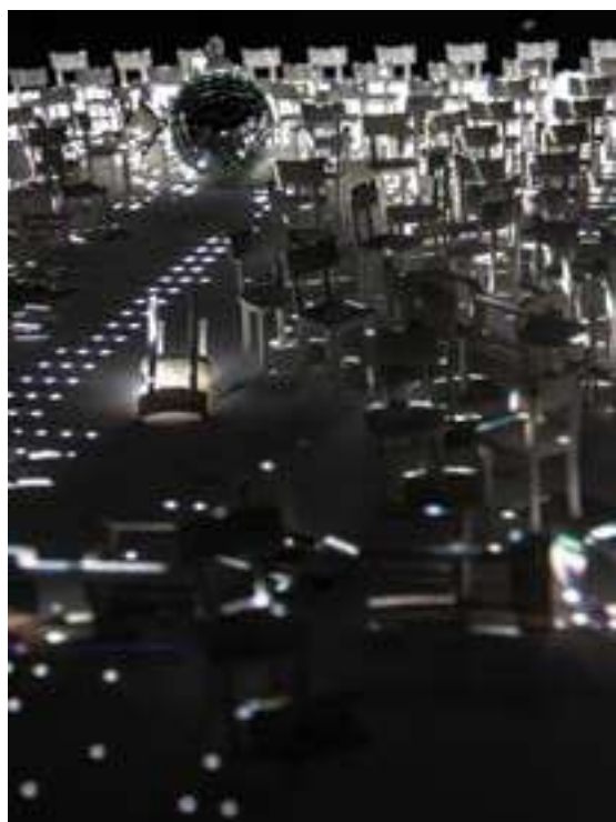
Strike © Adriaan Lokman