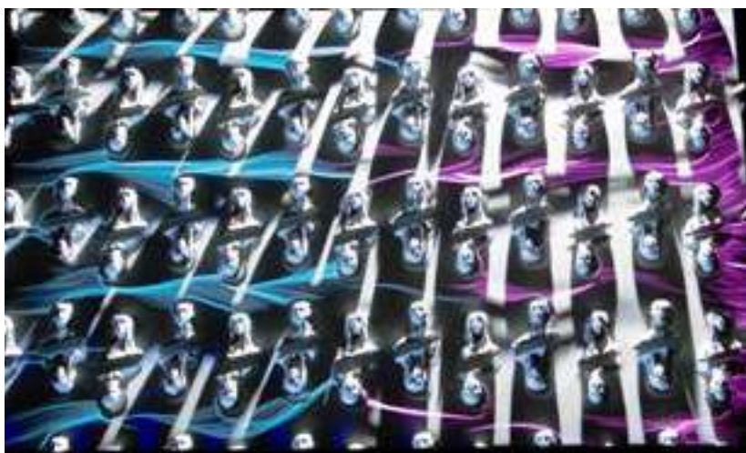
The Match © Adriaan Lokman