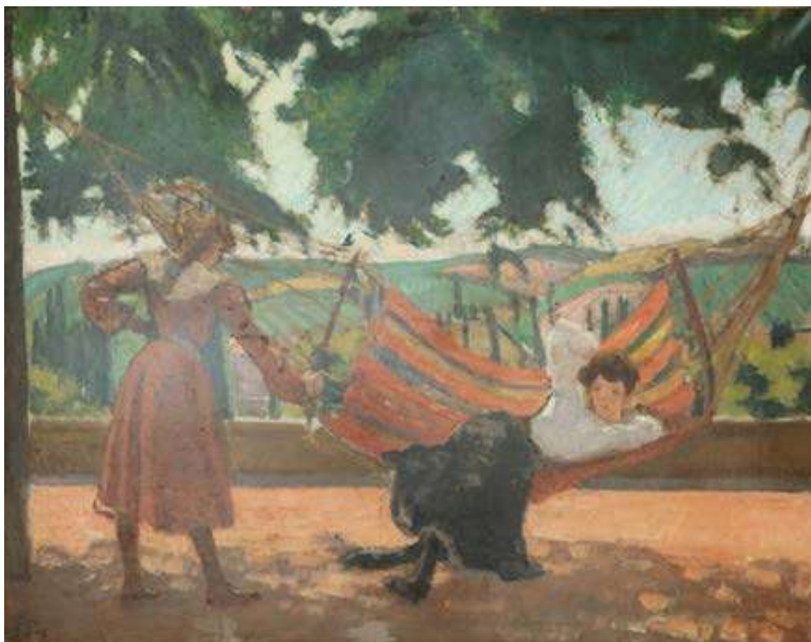
Le Hamac à Saint-Alban

NB : du 12 décembre 2020 au 12 avril 2021, cette visite atelier sera rattachée à l'exposition temporaire Jean Puy – Ambroise Vollard : un fauve et son marchand (cf. première partie du programme).