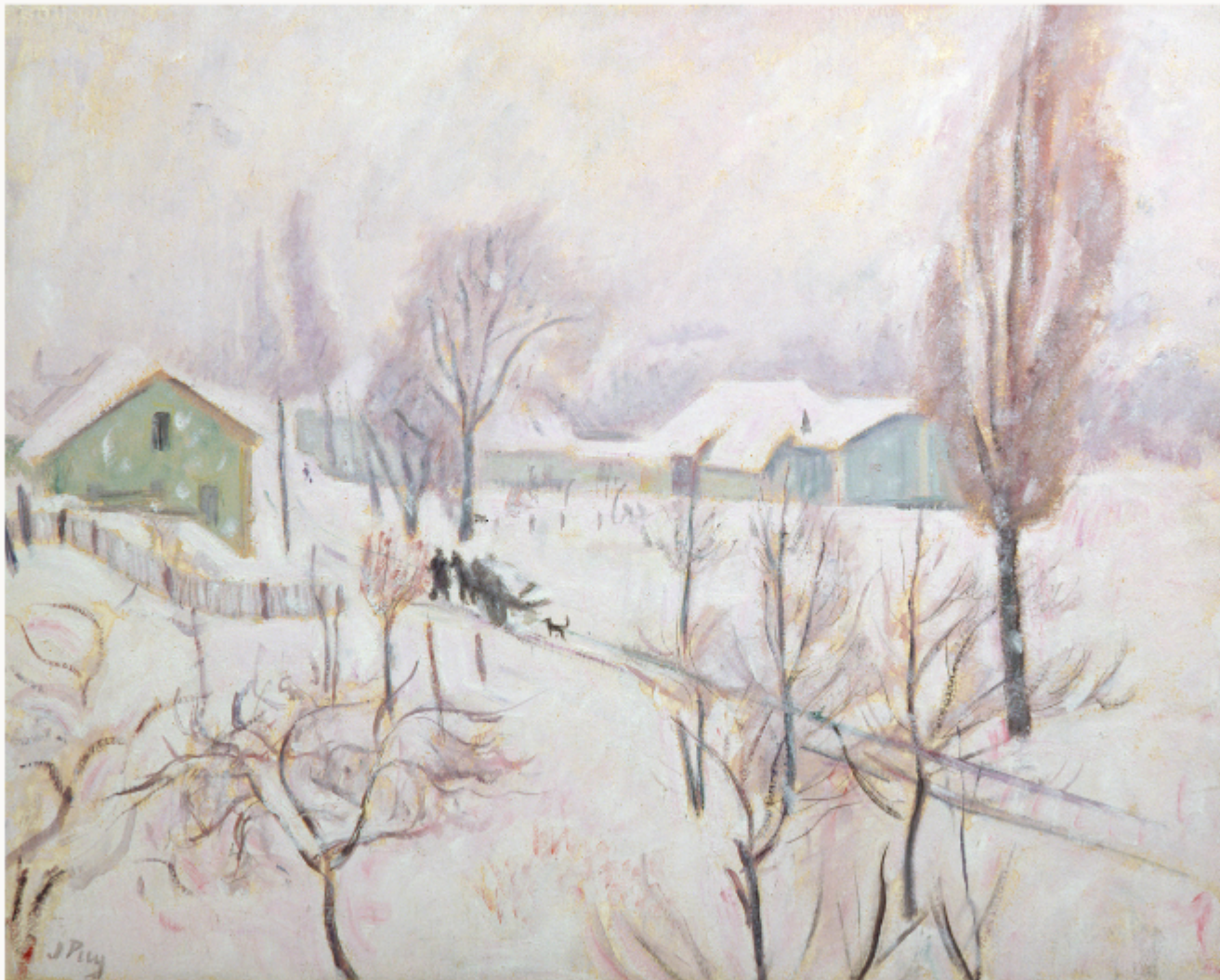
Jean Puy, Saint Luz-la-Croix-Haute, 1926

Transformez ce paysage hivernal aux couleurs douces en une version « noir et blanc » contemporaine.